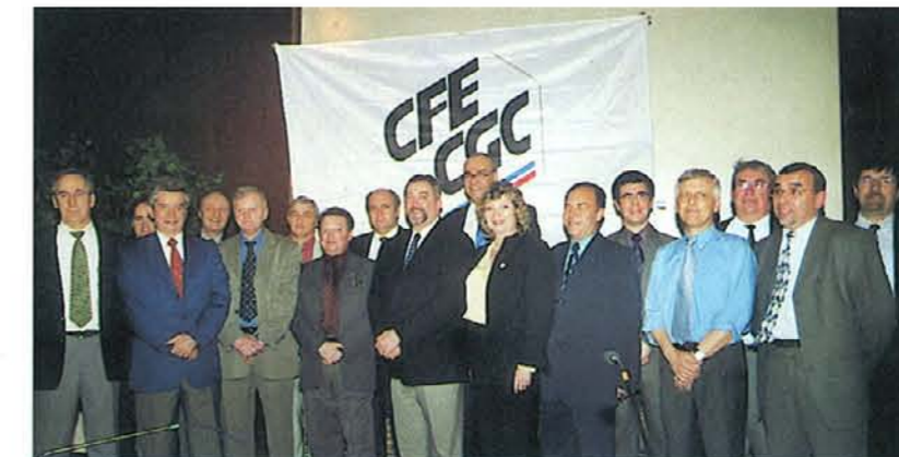
Le nouveau bureau du SMAV (Syndicat de la Métallurgie d'Alsace et des Vosges).