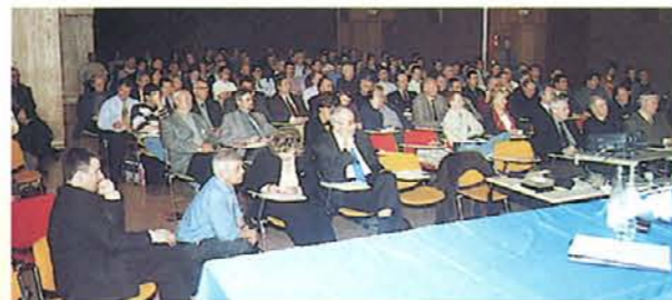
Le Centre Régional de l'Illberg (Mulhouse) bien rempli !