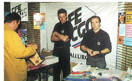
Une AG, cela commence par l'accueil !